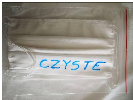
obraz nr 1