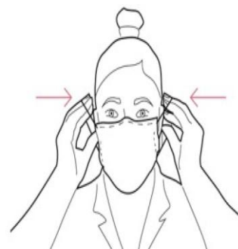
obraz nr 3